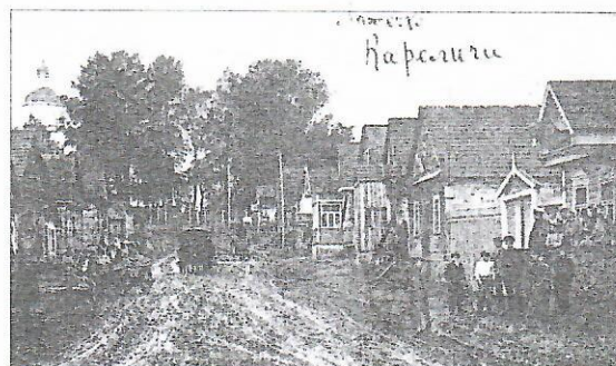
Мастэчка Карэлічы. Фота пачатку ХХ ст.

З 38-і дзяўчынак, якія вучыліся ў школе, на сустрэчу прыйшлі 20: 13 дзяўчынак з малодшай групы, 2 – з сярэдняй і 5 – са старэйшай. Інспектар пераказанаў, што вучанцы малодшай групы добра ведаюць малітвы, а старэйшыя пераказваюць розныя падзеі са Старога Запавету,